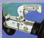
Antivol de tête d'attache