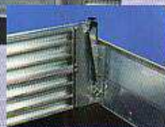
Fixation des rampes

Poids autorisé en fonction du modèle de rampe