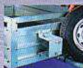
Support de roue de secours