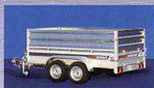
Réhausse ridelles 50 cm